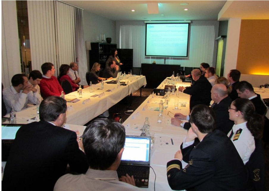
Obr.2 Národný workshop v Bratislave

Pracovný balík č. 2 bol zameraný na propagáciu projektu NELI. Výstupom tohto balíka je webová stránka pozostávajúca zo základných informácií súvisiacich s projektom NELI ( www.neliproject.eu ) vrátane jeho výstupov a príprava informačných brožúr.