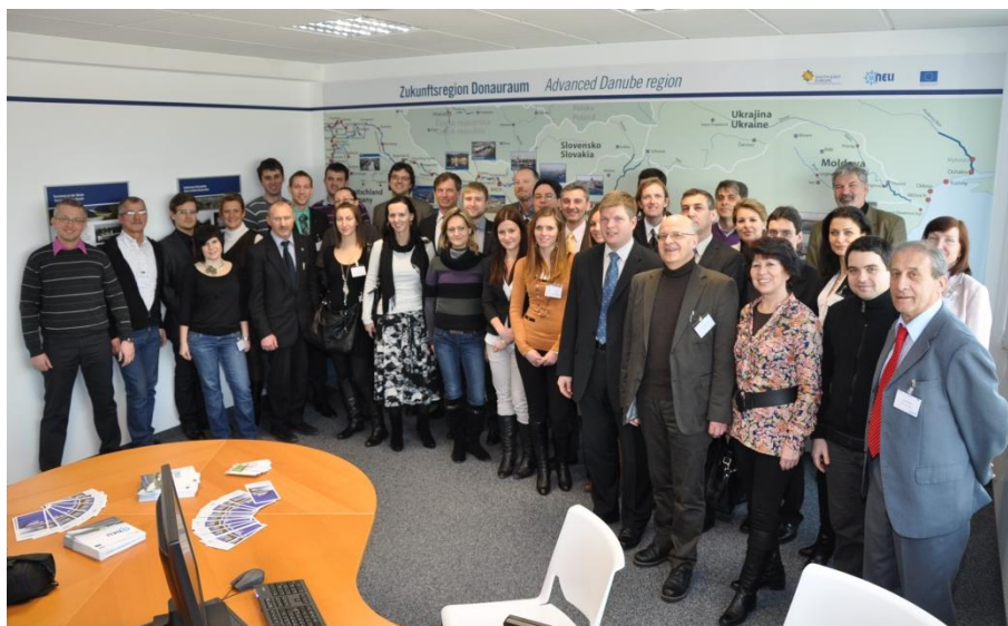
Obr.6 Otvorenie ITC v rakúskom Ennse