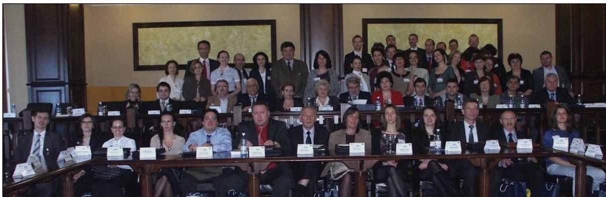
Obr.1 Ukončenie projektu NELI

Ako vyplýva z názvu cieľom projektu bolo vytvoriť sieť spolupráce inštitúcií, ktoré pôsobia v oblasti vzdelávania vo vnútrozemskej plavbe a logistike v povodí Dunaja a zvýšiť povedomie vnútrozemskej vodnej dopravy v očiach verejnosti. Na projekte participovalo pätnásť partnerov z ôsmich podunajských štátov, hlavným koordinátorom projektu bolo Rumunské námorné a vzdelávacie centrum (CERONAV). Zo Slovenska na projekte participovali dve vzdelávacie inštitúcie: Katedra vodnej dopravy (KVD) zo Žilinskej univerzity v Žiline a Katedra manažmentu výroby (KMV) z Technickej univerzity v Košiciach.