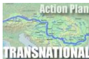
Obr.4 Národný akčný plán Slovenska a transnárodný akčný plán

V rámci pracovného balíka č.4 došlo k prekladu modulov e-learningového kurzu INeS (Inland Navigation e-learning System) do národných jazykov. Tento kurz, ktorý umožňuje e-learningové vzdelávanie, je rozdelený do šiestich oblastí vnútrozemskej vodnej dopravy: