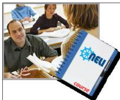
Obr.3 NELI kurzy